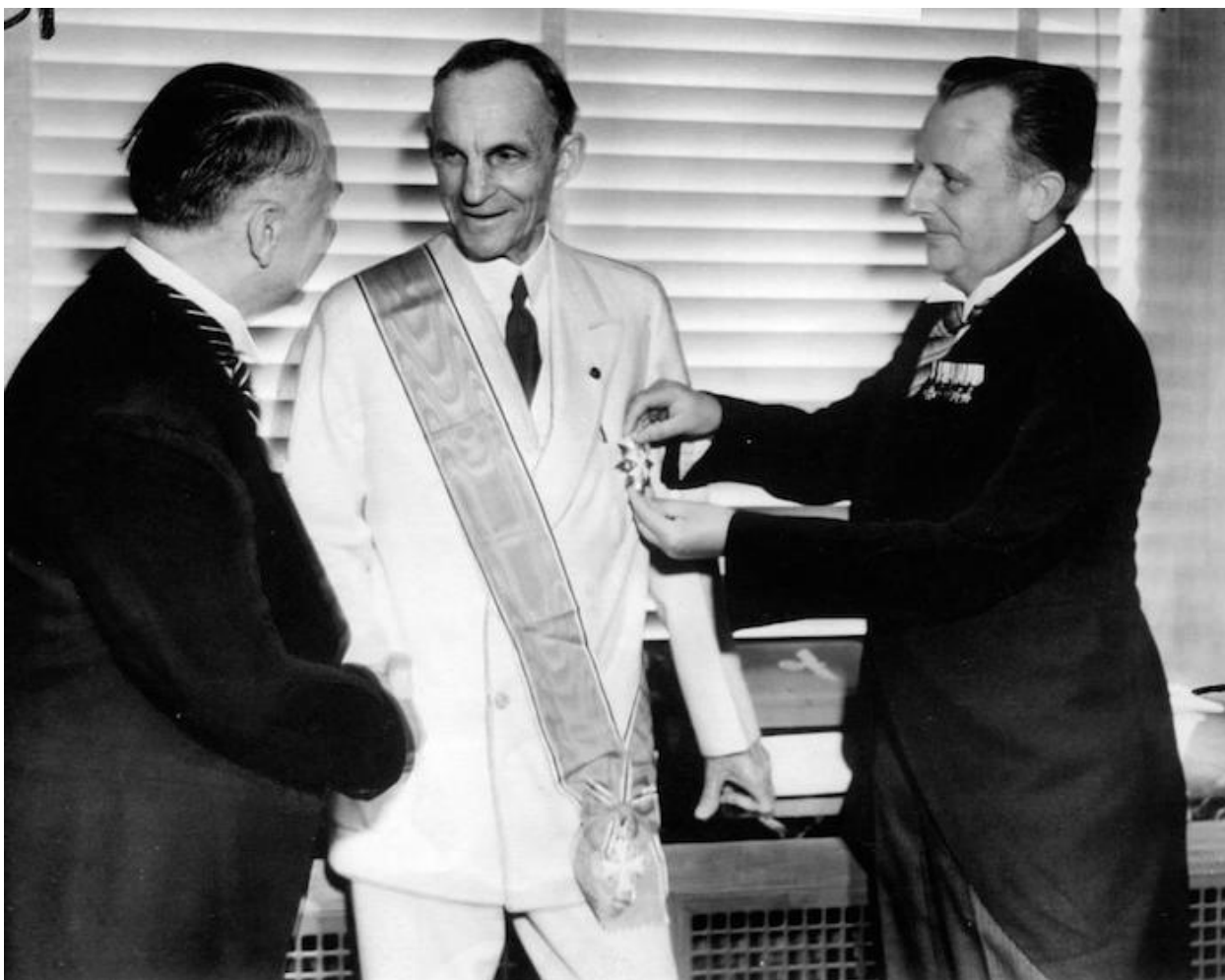
Генри Форд получает одну из высших наград нацистской Германии — Железного Орла — из рук высокопоставленных чиновников, 1938 год.

Генри Форд был сам по себе скандально известным антисемитом, издававшим подборку статей под чарующим названием «Международное еврейство. Исходная мировая проблема». Форд даже спонсировал свою собственную газету, которую он использовал как элемент пропаганды, обвиняя евреев в Первой мировой войне, а в 1938 году получил Орден заслуг германского орла, высший знак отличия нацистской Германии, которым награждались иностранные граждане.